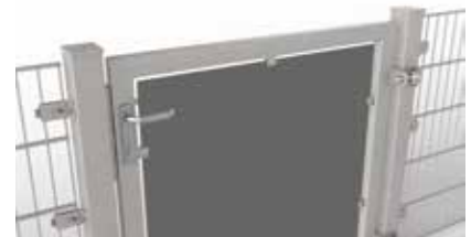
Torfüllung aus Trespa®-Platte