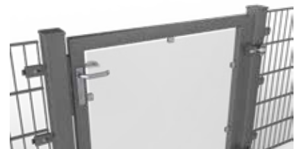
Torfüllung aus Verbundsicherheitsglas