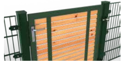
Torfüllung aus Naturholz (Sibirische Lärche)