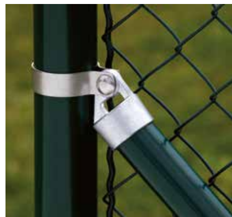
1-flügelig, Breite 1000 mm bzw. 1500 mm