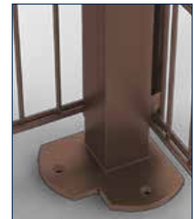
Eckpfahl mit Bodenplatte