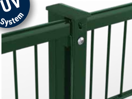
RANKO Profilschienenpfahl, vollständig aus Metall, hier mit Handlauf U-Profil auf der Doppelstabmatte