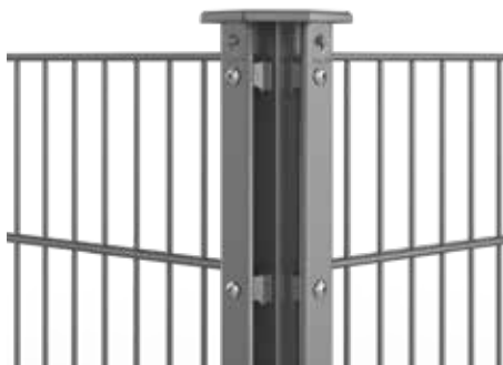
RANKO Profilschienenpfahl für Ecken im Winkel von ca. 90°