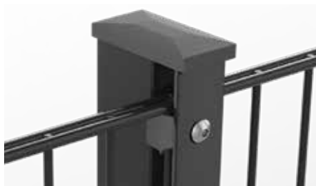
RANKO Multipfahl mit Flacheisen und Kappe mit Überstand