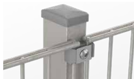
RANKO Multipfahl mit Flachklemmplatten