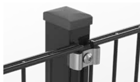
RANKO Multipfahl mit Klemmplatten mit langen Schenkeln