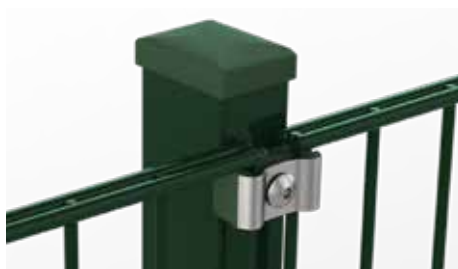
RANKO Multipfahl mit Klemmplatten mit kurzen Schenkeln