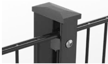
RANKO Multipfahl mit Flacheisen und Kappe mit Überstand