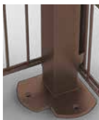
Eckpfahl mit Bodenplatte