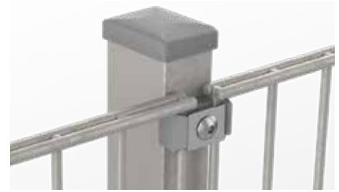
RANKO Multipfahl mit Flachklemmplatten