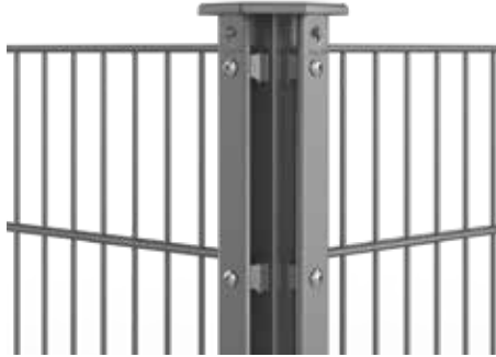
RANKO Profilschienenpfahl, für Ecken im Winkel von ca. 90°

Entsprechen den hohen Anforderungen der GUUV*