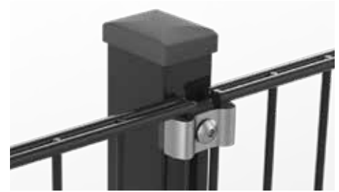
RANKO Multipfahl mit Klemmplatten mit langen Schenkeln