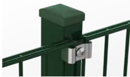
RANKO Multipfahl mit Klemmplatten mit kurzen Schenkeln