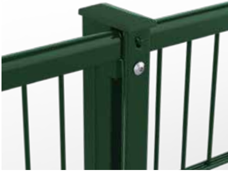
RANKO Profilschienenpfahl, vollständig aus Metall, hier mit Handlauf U-Profil auf der Doppelstabmatte