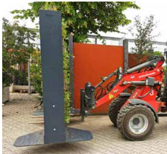
Die Mobile Gabione kann mit Stapler, Radlader oder Hubwagen transportiert werden.