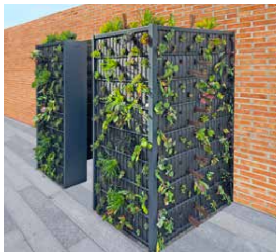
Ästhetik mit Funktion: Eck-Gabionen mit Eckelementen