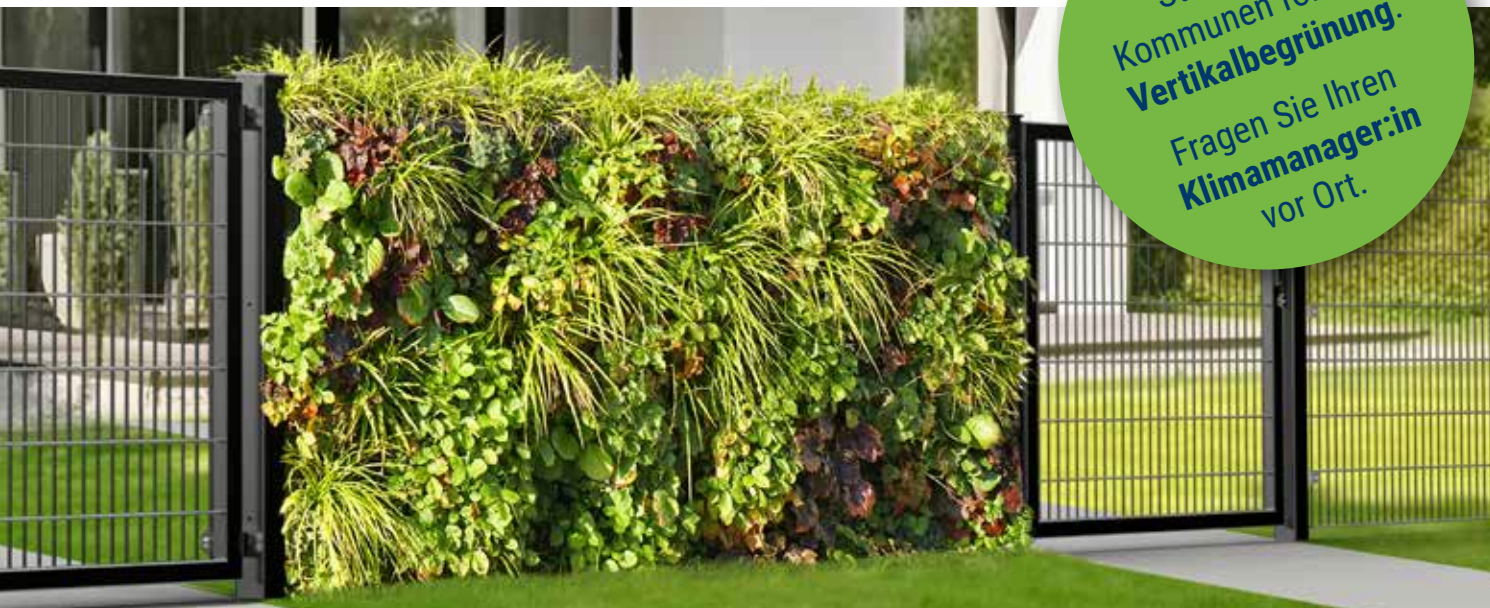
Die RANKO Pflanzen-Gabione macht auch in jedem Zaunverlauf eine gute Figur.

Viele Städte und Kommunen fördern Vertikalbegrünung . Fragen Sie Ihren Klimamanager:in vor Ort.