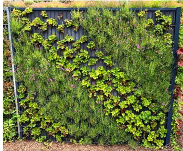
Wachstums-Plus: tolle Ergebnisse schon nach ca. 2 Monaten