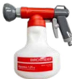
Birchmeier Aquamix Dünger-Spritze